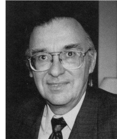
Marcian Edward Hoff, Jr.