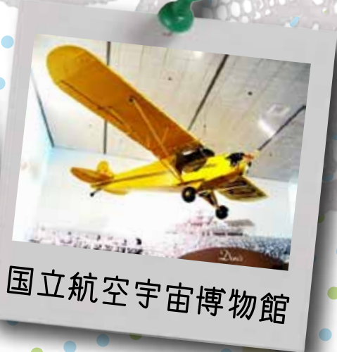
国立航空宇宙博物館