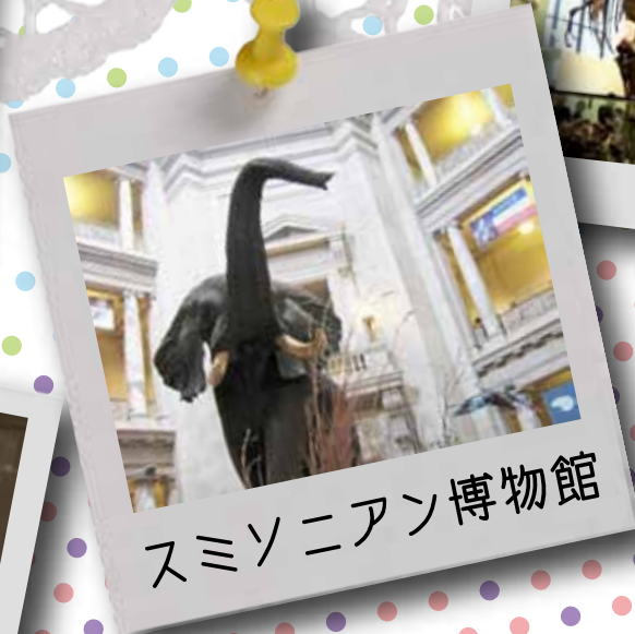
スミソニアン博物館